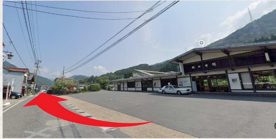
Exit the station and turn right