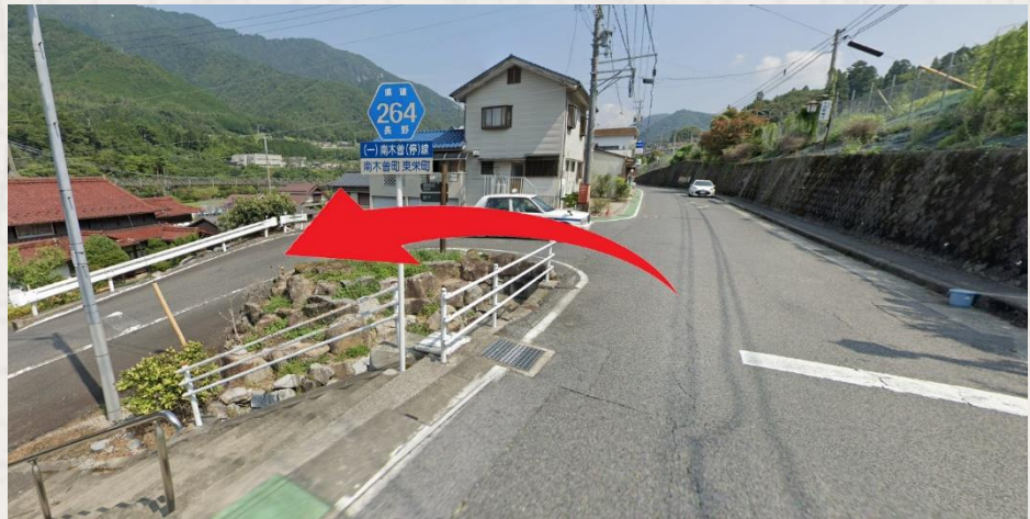
Turn left at the intersection going down 在路口左轉下走