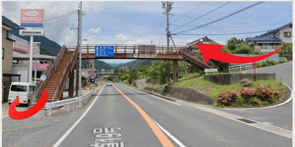
For safety, please use pedestrian crossings. 為了安全，請走人行橫道